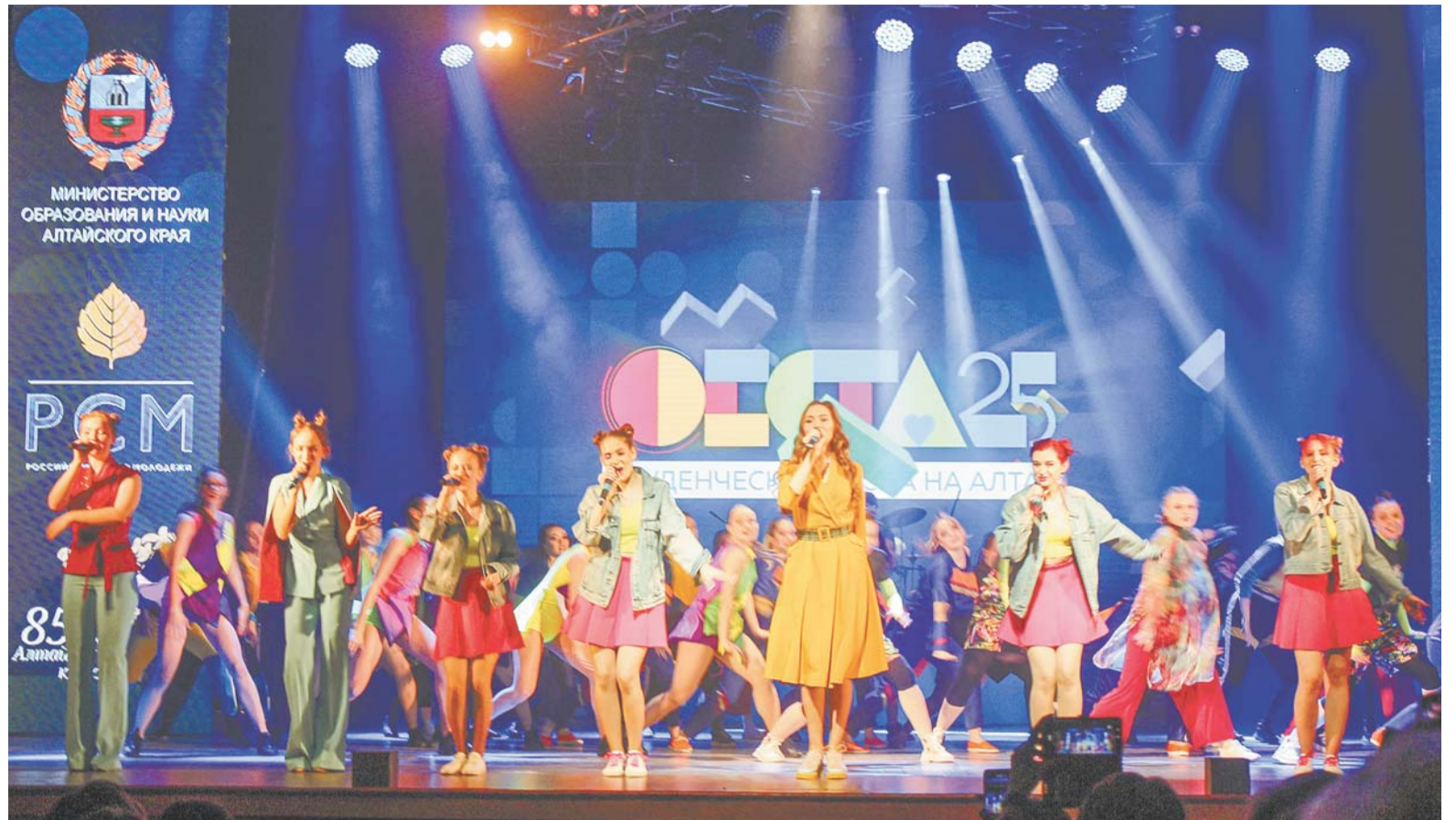
Ежегодно в студенческом фестивале участвует все больше творческой молодежи.

В этом году «Студенческая весна на Алтае» отмечает 25-летие, а «Российская студвесна» — 30-летие.